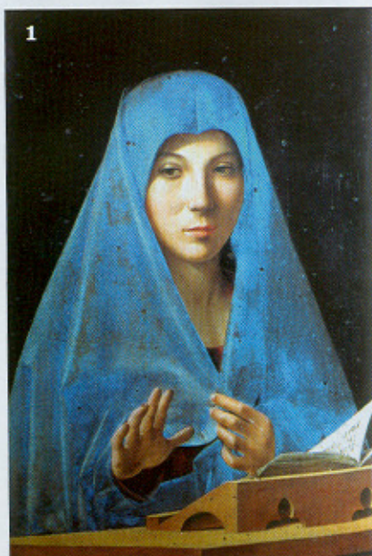
1-2. Antonello da Messina: La Vergine Annunziata e San Sebastiano . 3-4. Amedeo Modigliani: Donna con vestito scozzese (1916), e Ragazzo con giacca azzurra, appoggiato a un tavolo (1918-19).