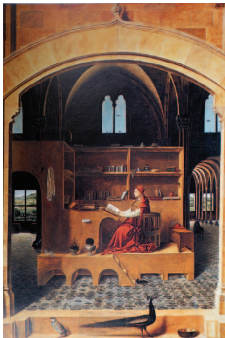
San Girolamo nello studio Londra, The National Gallery

La mostra si propone di ricostruire compiutamente la figura di Antonello da Messina e indaga le tematiche da lui sviluppate, riunendo alle Scuderie del Quirinale la quasi totalità delle sue opere, dal "San Girolamo nello studio" della National Gallery di Londra al "San Sebastiano" di Dresda, alla "Crocifissione" di Anversa. I dipinti del maestro messinese sono messi a confronto con quelli di grandi artisti, fra gli altri, Van Eyck, Bellini, Cima da Conegliano, Laurana.