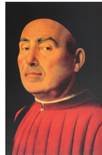
Ritratto d'uomo Torino, Museo Civico d'Arte Antica

campeggiare, spolverare, grattare, granare ovvero camucciare, ritagliare, colorire, adornare, e inverniciare in tavola ovvero in icona." (da Cennino Cennini) Un ciclo di incontri con le opere in mostra, e le tecniche in laboratorio, per apprendere i linguaggi artistici del Quattrocento e sperimentare l'impennatura e l'ingessatura; il disegno, lo spolvero e la quadrettatura; la tempera a uovo e la pittura a olio; la doratura.